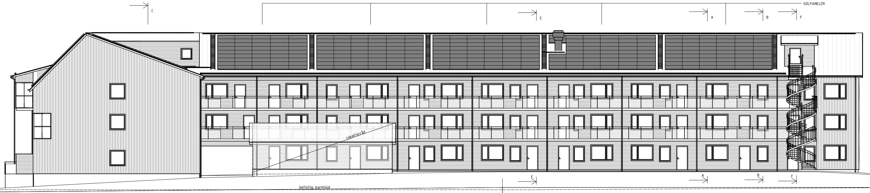
FASAD MOT NORR 1:100 (A3 1:200)